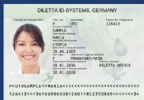
Imagen clara y completa de la página principal del pasaporte o carné de residencia vigentes, donde se vea bien toda la información ( NO FOTOCOPIA ).

DIRECCIÓN DEL SISTEMA DE ADMISIÓN Vicerrectoría Académica admisiones.unah.edu.hn f Admisiones UNAH @admisionesUNAH