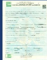
Imagen clara y completa de la parte frontal del Documento Nacional de Identificación (DNI) donde se vea bien la fotografía y toda la información ( NO FOTOCOPIA ), o una imagen clara y completa de la partida de nacimiento donde se vea bien toda la información ( NO FOTOCOPIA ).