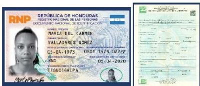
Imagen clara y completa de la parte frontal del Documento Nacional de Identificación (DNI) donde se vea bien la fotografía y toda la información ( NO FOTOCOPIA ), o una imagen clara y completa de la partida de nacimiento donde se vea bien toda la información ( NO FOTOCOPIA ).