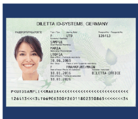
Imagen clara y completa de la página principal del pasaporte o carné de residencia vigentes, donde se vea bien toda la información ( NO FOTOCOPIA ).

DIRECCIÓN DEL SISTEMA DE ADMISIÓN Vicerrectoría Académica admisiones.unah.edu.hn